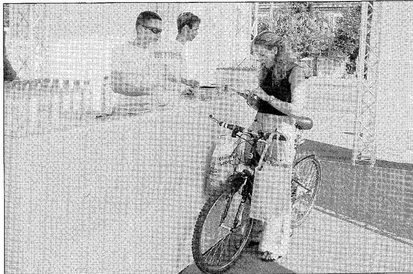
Spontan liessen sich die Zürcher und Zürcherinnen mit den Glarnern auf Gespräche übers Wasser und übers Glarnerland ein.

Und so wie das Wasser aus dem Glarnerland auf vielen Wegen durch Wiesen und Felder dank der Linthebene in den Zürichsee strömt, zieht es Glarnerinnen und Glarner immer wieder in die heimliche Hauptstadt der Schweiz. ● pd